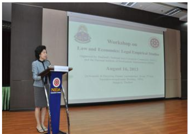
วันที่ 16 สิงหาคม 2556 สำนักงาน ปปช. ร่วมกับศูนย์ นิติเศรษฐศาสตร์ (นิด้า) จัดบรรยายในหัวข้อกฎหมายและ เศรษฐศาสตร์